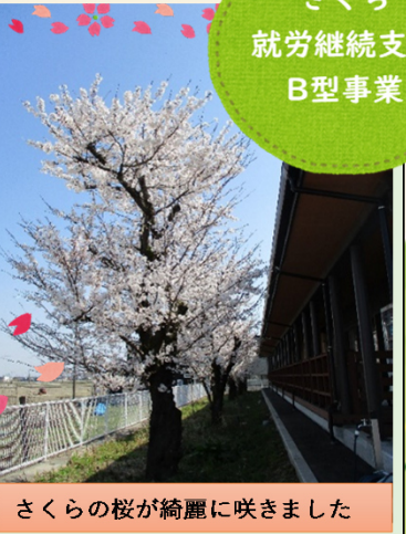
さくらの桜が綺麗に咲きました